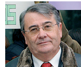
Real, decano desde 2006. A.N.

Sobre la llegada de los bufetes españoles, Vieira de Almeida es de la opinión de que tardaron demasiado en poner los ojos en el mercado luso y, si hubiesen llegado antes, se habrían hecho con todo el negocio. Pero para el abogado, cuando aterrizaron en Lisboa, la abogacía portuguesa ya se había sofisticado lo suficiente para plantar cara y generar un mercado competitivo. ♦