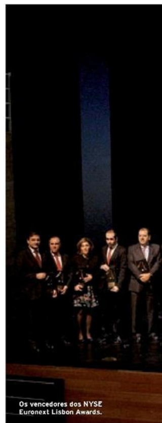
Os vencedores dos NYSE Euronext Lisbon Awards.