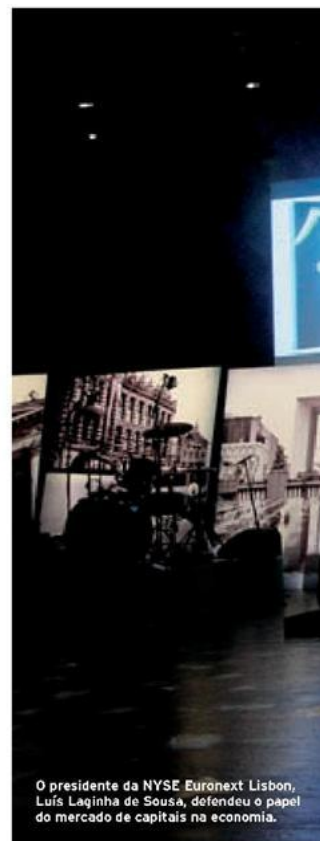
O presidente da NYSE Euronext Lisbon, Luís Laginha de Sousa, defendeu o papel do mercado de capitais na economia.