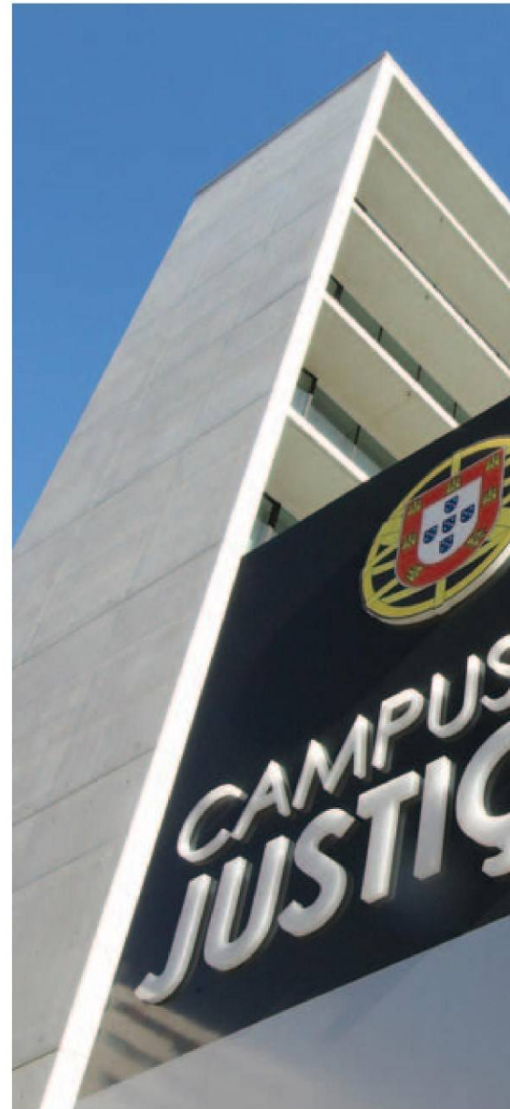
Histórico | Perdeu os casos de abuso de posição dominante julgados. Nos cartéis